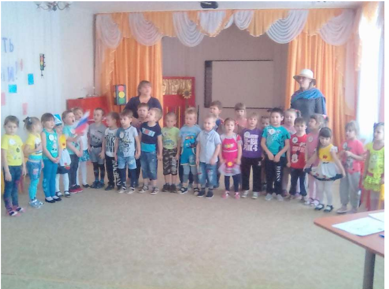
Игроки и болельщики исполняют песню “светофор”