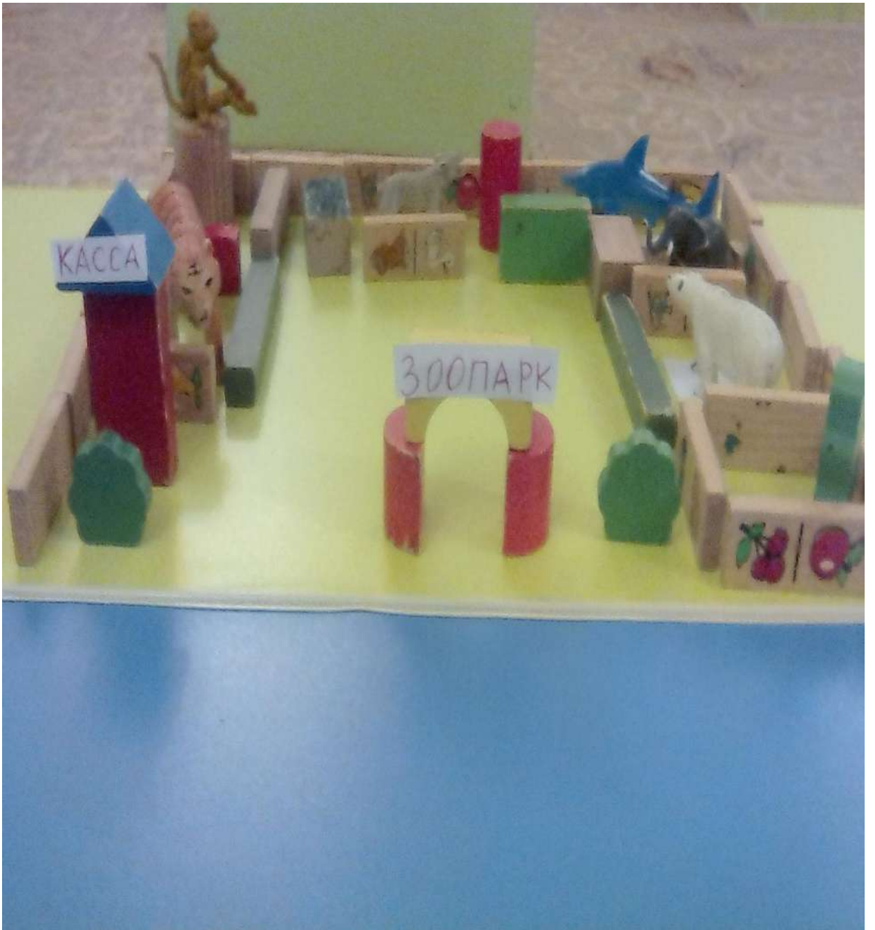
Зоопарк из строительного материала