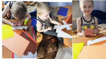
Данил Копцев. Конструирование из бумаги Игрушка "Пчёлка гармошка"