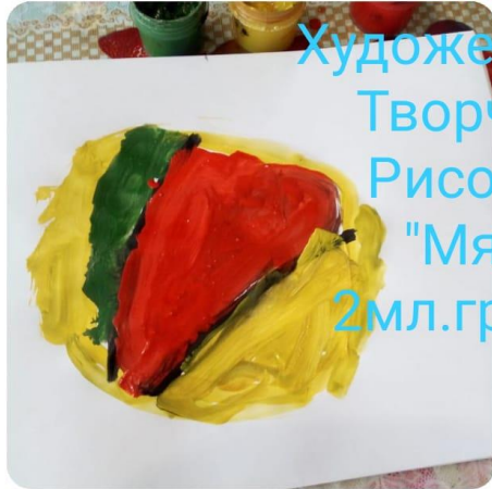
Художественное Творчество. Рисование. "Мячик". 2мл. группа 1.